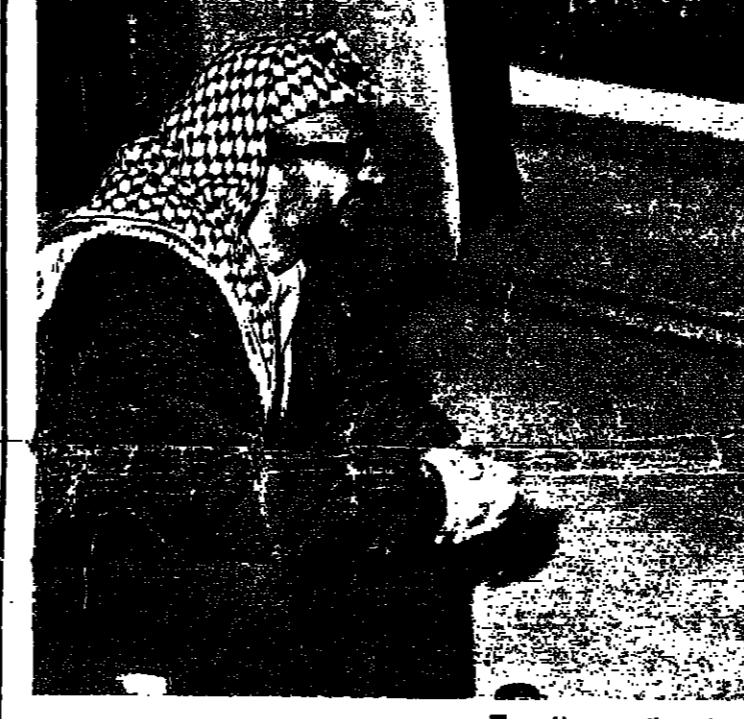
الرئيس السادات والسيد عرفات

قال مصدر رسمي في بيروت ، ان الرئيس فرنجييه سيصل الى دمشق اليوم الاحد ، لحضور مؤتمر قمة ريماسي مع الرئيسين السادات والاسد والسيد ياسر عرفات . وذكر المصدر ان الرؤساء الثلاثة والسيد عرفات سيبحثون تطورات الوضع العربي وخطة العمل في المرحلة الثانية المقبلة . وقد وصل الى دمشق مساء امس ، قلمنا من عمان ، الرئيس السادات . وكان الرئيس الاسد في استقباله بالمطار . وبدأت المحادثات بين الرئيسين على الفور . كما وصل الى العاصمة السورية مساء امس ، السيد عرفات قلمنا من ليبيا حيث افتتح اسبوع فلسطين . السادات لا يدخل لجنيف وكان الرئيس السادات قد أعلن